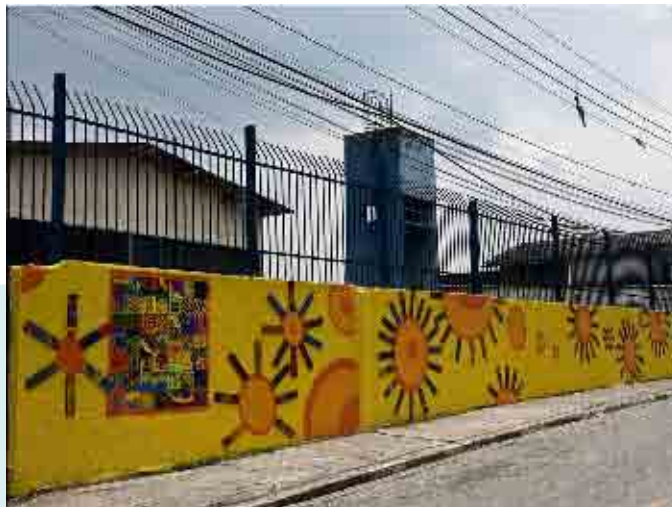
EMEI Vila Calú - Jd. Ângela - Foto: Drago

etc. Destas formas surgem os hábitos pessoais que, repetidos ao longo do tempo, criam os costumes coletivos. Estes, após gerações, desenham as tradições que, por sua vez, darão identidade a certa comunidade ou povo e se constituirão em formas de conhecimento.