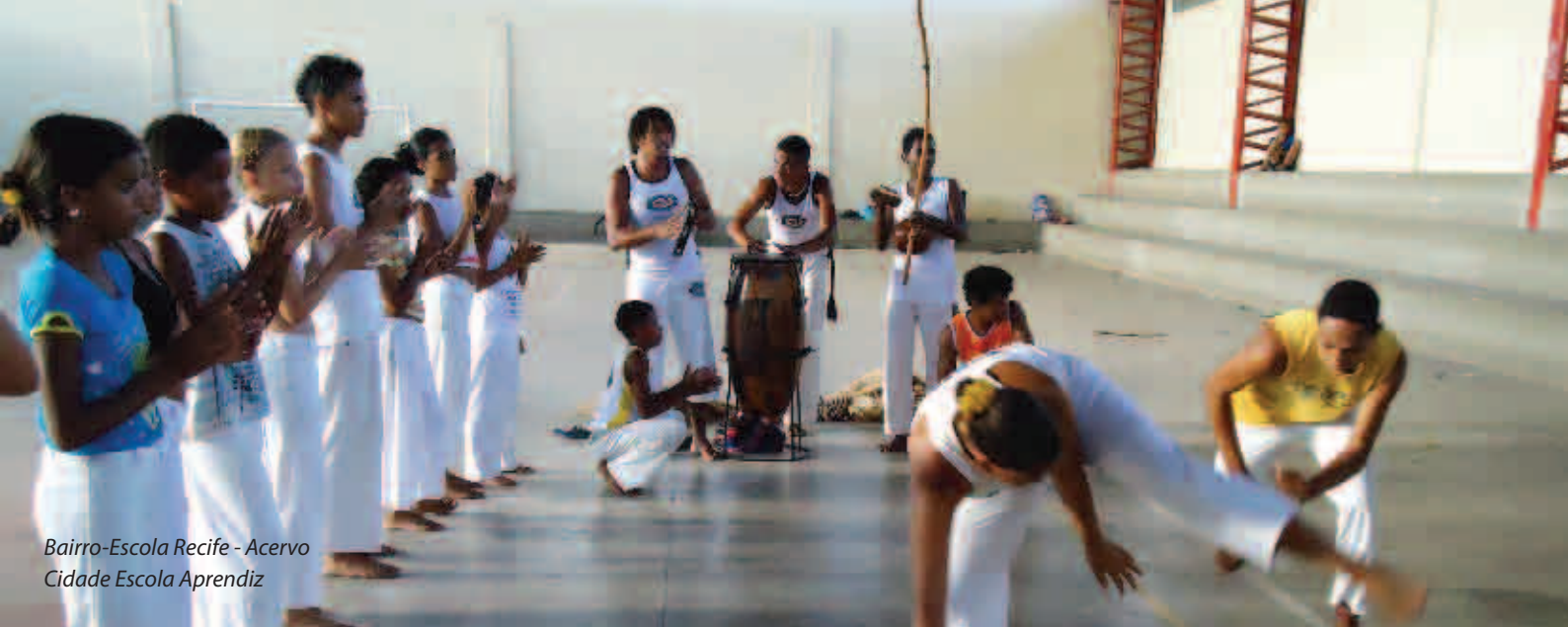
Bairro-Escola Recife