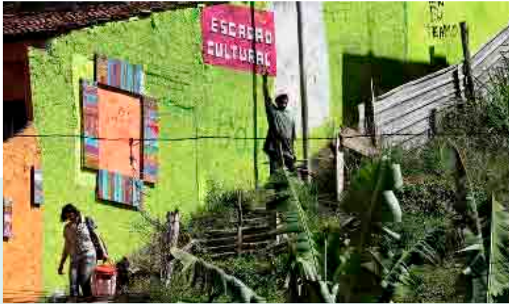
Chácara Sonho Azul

cultural do município, a lógica da espetacularização começa a se manifestar com mais contundência. A partir de 1996, os desafios neste sentido aumentam e a proposta inicial do projeto se enfraquece. Algumas das causas deste problema foram: