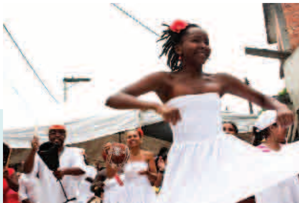
Chácara Sonho Azul

em Morte e vida de grandes cidades , 10 e defende que uma cidade tem a ver com a diversidade dos espaços que a compõe. Se as pessoas ocupam integralmente um bairro, ele estará sempre vivo e em movimento, enquanto espaços vazios são ocupados por situações de degradação.