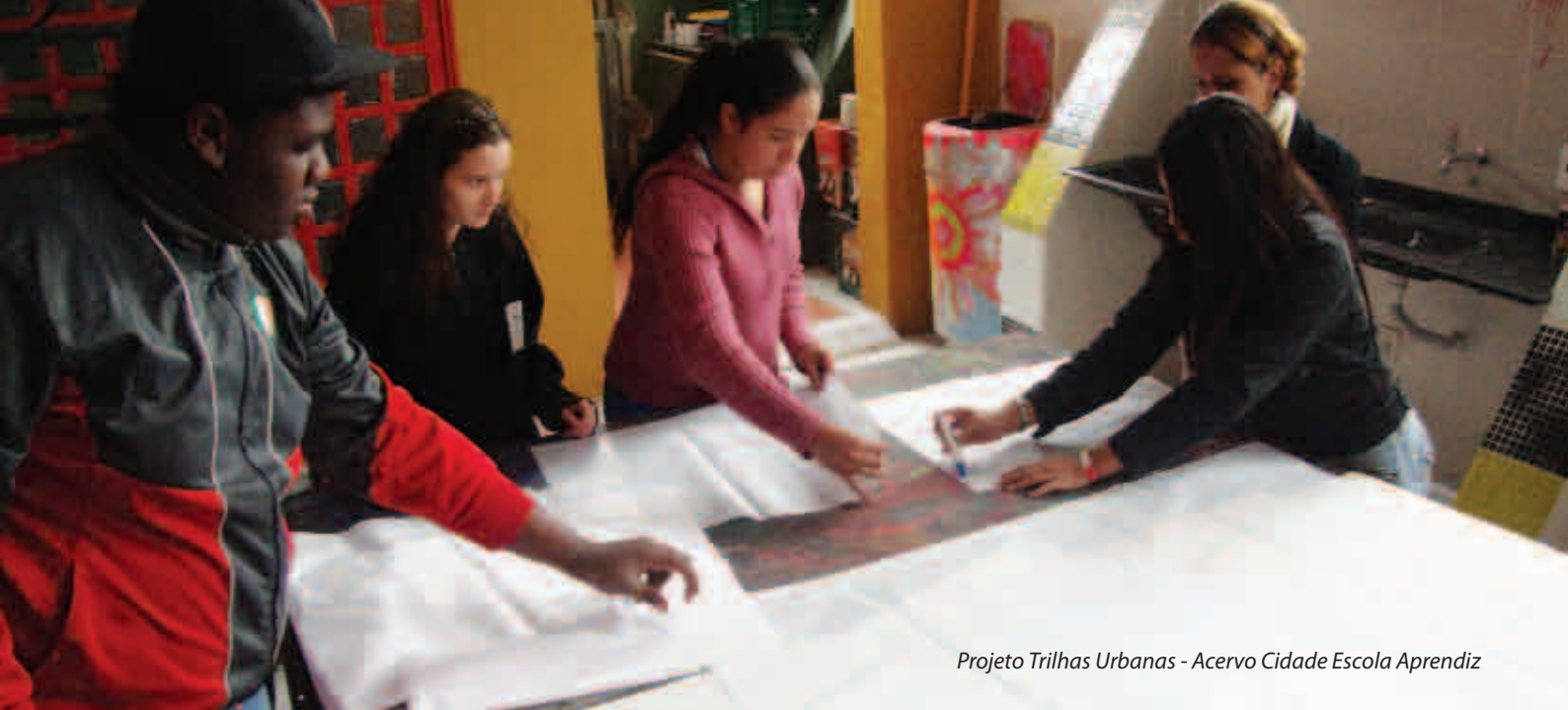
Projeto Trilhas Urbanas - Acervo Cidade Escola Aprendiz