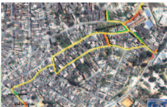
Mapa com o percurso feito pela intervenção no Jardim Ângela

O processo de fomento ao Bairro-Escola na região se iniciou com as oficinas que visavam a intervenção e tiveram o duplo sentido de produção e mobilização. No dia da grande oficina comunitária, a presença e envolvimento da população local demonstraram o impacto do processo. O mapa abaixo indica o percurso feito pela intervenção no Jardim Ângela.