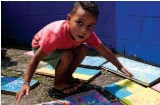
EMEI Chácara Sonho Azul - Pintura em madeira