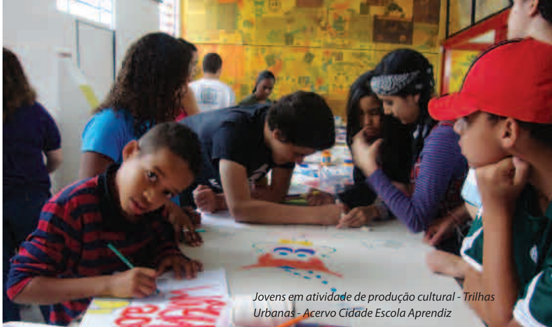
Jovens em atividade de produção cultural - Trilhas Urbanas - Acervo Cidade Escola Aprendiz

expressão, quanto na leitura que realizamos.