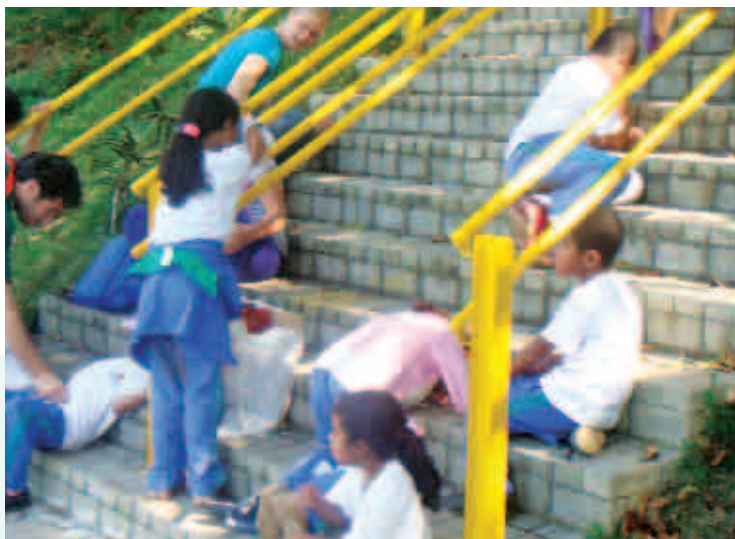
Trilha Nossa Praça - Escola na Praça

Neste tipo de vivência, portanto, a dimensão corporal é muito presente. Os sentidos são instigados a construir um significado para a experiência. A sensibilidade se apura. A criatividade se expressa. A relação entre indivíduo e grupo se constrói. O conhecimento não é fragmentado, nem hierarquizado. Não se divide a experiência por áreas do saber, nem se prioriza um aspecto em detrimento de outro. A educação é vista como uma rede integrada de saberes, que leva em conta todas as formas de se relacionar, experimentar, sentir e interpretar o mundo externo e interno.