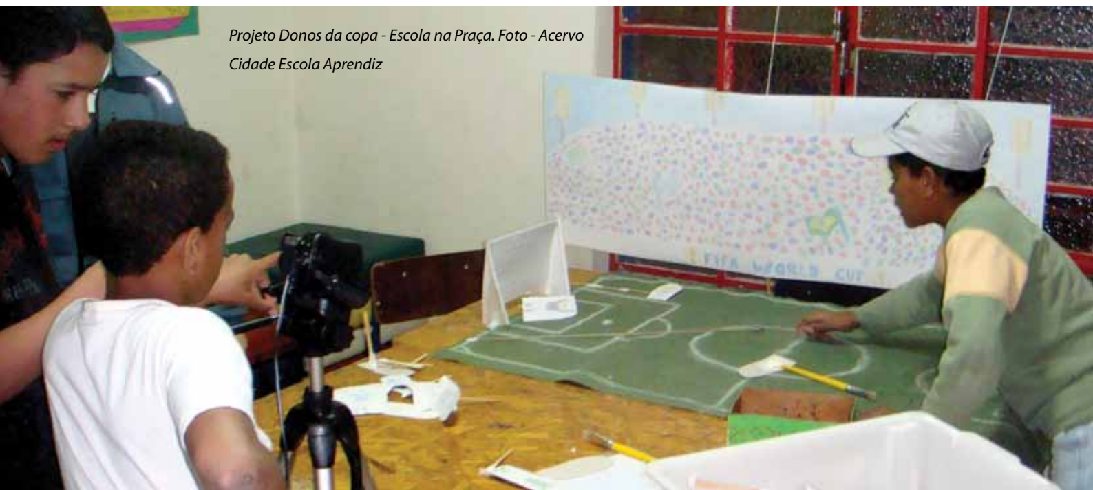
Projeto Donos da copa - Escola na Praça.

Outro relato significativo da experiência de se tornar um emissor na comunicação vem de Gláucia, que tem 14 anos e participa de projetos do Aprendiz há nove anos. A adolescente já experimentou várias linguagens de comunicação. A partir da trilha Donos da Copa,