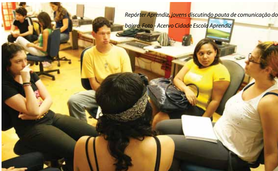
Repórter Aprendiz, jovens discutindo pauta de comunicação do bairro.

Quando se apropriam da comunicação como produtores, os jovens passam a ter um novo