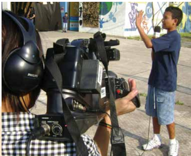
Agência Comunitária Cambuci

No entanto, para que se consiga passar do individual para o coletivo, é preciso criar espaços de participação democrática, ativos e permanentes, onde a comunidade se sinta à vontade para trazer suas questões e explorar novas possibilidades. É nessa perspectiva que as Agências Comunitárias de Notícias, enquanto estratégia do Bairro-Escola, assumem o papel de facilitadoras do processo de aproximação desses atores e instituições. Assim, mais do que agências de comunicação, elas podem ser entendidas como agências de mobilização, em que a comunicação é apenas um instrumento de aproximação das pessoas e não o seu objetivo final.