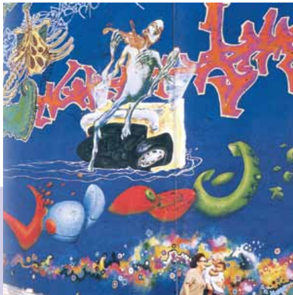
Projeto 100 Muros - 1998 a 2000.