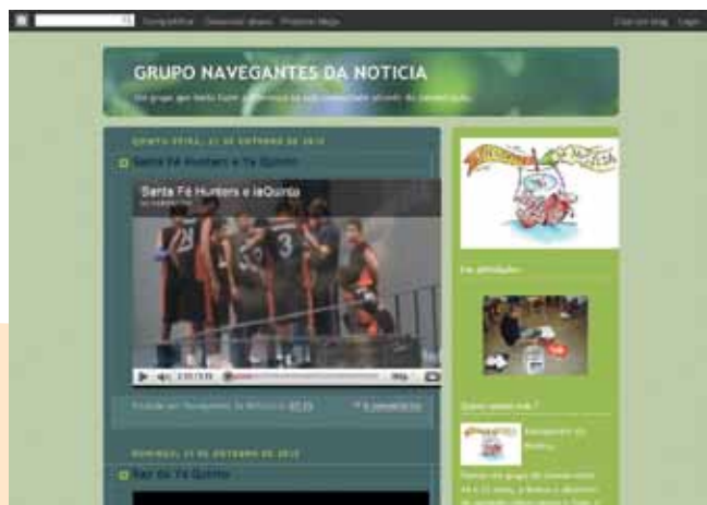
Navegantes da Notícia Grajaú - São Paulo

sustentabilidade. No lugar de um receptor passivo, “bancário” da informação, entra o agente ativo, transformador de seu meio e coletivo - e isso nada mais é do que um ato político. Somente por meio deste ato - que embute, necessariamente, a intenção de dar vazão aos sonhos, às demandas e (por que não?) à transformação e sustentabilidade daquele território -, é possível promover a verdadeira articulação entre os diferentes setores.