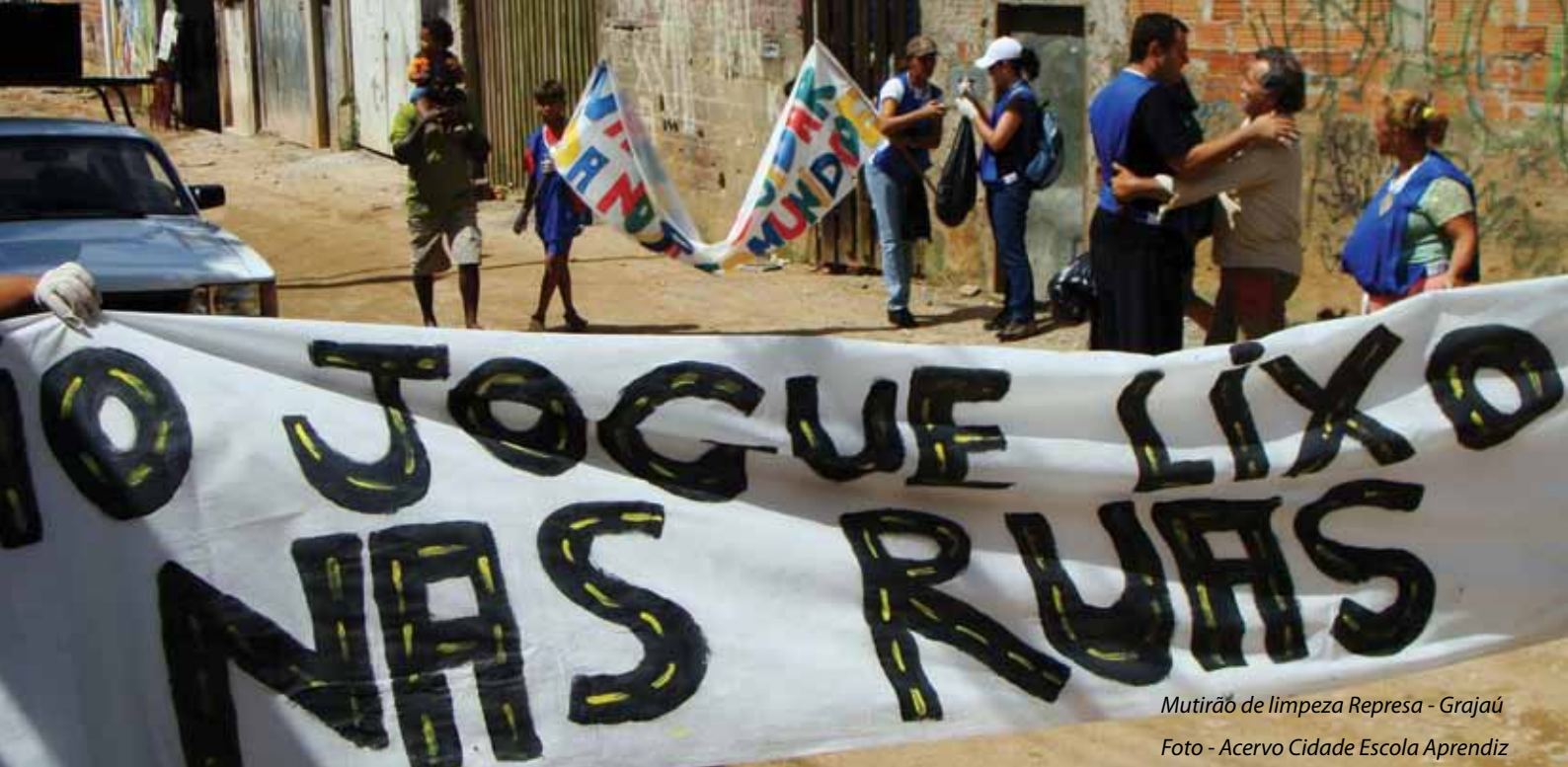
Mutirão de limpeza Represa - Grajaú