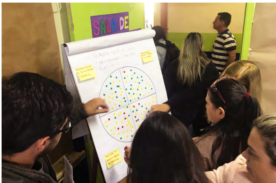
Fig.1 Exemplo de professores realizando autoavaliação rápida sobre práticas de Educação Integral em Tremembé, SP.

Após cada membro do grupo escolher sua cor e a adicionar no gráfico (por meio de etiqueta ou desenhando uma bolinha com a cor escolhida), a equipe faz uma breve roda de conversa sobre o gráfico: